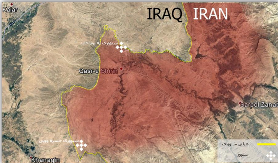
وینه‌ی هه‌وای ناوچه‌ی توپوگرافی هه‌یه ، سه‌رچاوه: توپوگرافی، ٢٠١٧، (٢)

سنووری په‌رویزخان وه‌کو پووبه‌ریکی رامیاری بو‌ ناوچه سنووریه‌کانی نیوانی هه‌ریمی کوردستان و وولاتی ئیران له پوانگه‌ی نابووری و کۆمه‌لایه‌تی پیگه‌یه‌کی ستراتیجی هه‌یه که له‌به‌رامبه‌ر پارێزگای سلیمانییه و نزیکترین شاری سنووری له لای هه‌ریمی کوردستان که‌لار و له لای ولاتی ئیران قه‌سری شیرین وه له مه‌ودای ٣٠٥ کم له باکوری شاری قه‌سری شیرینه .